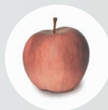
LED normale: colori falsati