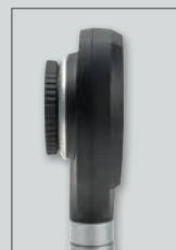
senza piastrina di contatto

Testa dermatoscopio NC 1 senza piastrina di contatto, Testa otoscopio mini 3000 LED F.O., 2 manici batterie mini 3000 (con batterie), con cadauno 5 speculum monouso Ø 2,5 e 4mm, Astuccio con cerniera lampo [02] D-891.11.021