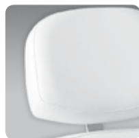
small Zak head rest testa Zak piccola cod. 111P