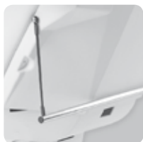
roll holder porta rotolo cod. 108