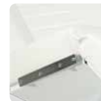
seat and back medical guides guide medicali seduta e schiena cod. 316-317