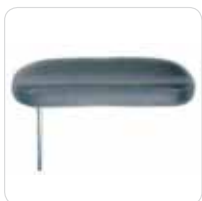
medical armrest couple coppia braccioli medicali cod. 313