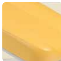
anatomic mattress w/out sewing materasso anatomico senza cuciture cod. 109