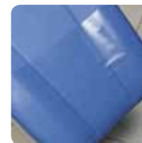
plastic cover proteggi gambe cod. Prot. gambe