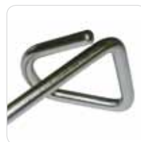
heel support couple coppia di reggi tallone cod. LEM - 151