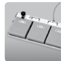
foot pedal control pedale cod. LEM-067