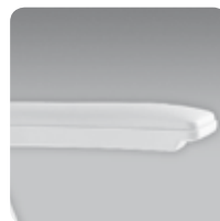
flat arm rest couple coppia braccioli automatici cod. 107