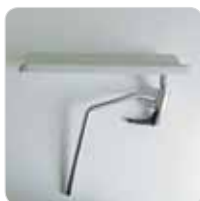
blood-sample taking armrest couple coppia braccioli da prelievo con snodo cod. 314