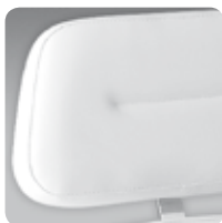
big Zak head rest testa Zak grande cod. 111