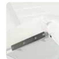
seat and back medical guides guide medicali seduta e schiena cod. 316-317