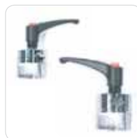
fixed and rotating clamps morsetti fissi e girevoli cod. 319-320